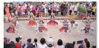
ชุมชนคุณธรรมวัดคลองแห จังหวัดสงขลา https://youtu.be/NMNdUzUx18