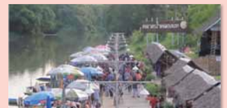
ชุมชนคุณธรรมวัดคู้ยาง จังหวัดสุโขทัย https://youtu.be/0L60eSh8QhE