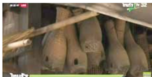
ชุมชนคุณธรรมวัดศรีโพธิ์ชัย จังหวัดฉะเชิงเทรา www.youtube.com/watch?v=2BcFj8vNjK