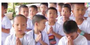
ชุมชนคุณธรรมคลองมะขวิด จังหวัดสมุทรสงคราม https://www.youtube.com/watch?v=yUphLurRyl