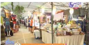
ตลาดนัดชุมชนคุณธรรม จังหวัดเพชรบูรณ์ https://www.youtube.com/watch?v=IbLE5BKLOQE