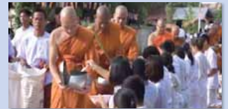
ชุมชนคุณธรรมวัดโพธิ์ไกราม จังหวัดร้อยเอ็ด https://youtu.be/dDWiLlB6pSE