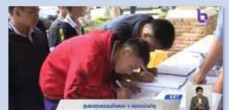
ชุมชนคุณธรรมบ้านหนองกุงคำไฮ จังหวัดหนองบัวลำภู www.youtube.com/watch?v=MeGCgGvFzHo

ชุมชนคุณธรรมน้อมนำหลักปรัชญาของเศรษฐกิจพอเพียง ขับเคลื่อนด้วยพลังบวร นำพาประเทศไทย “มั่นคง มั่งคั่ง ยั่งยืน”