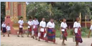
ชุมชนคุณธรรมวัดจำปา จังหวัดศรีสะเกษ www.youtube.com/watch?v=4Ms9JxcQ13E