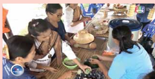
ชุมชนคุณธรรมไทย-ลาวแนวท่อนอง จังหวัดสิงห์บุรี www.youtube.com/watch?v=ESzRUSTxOvc