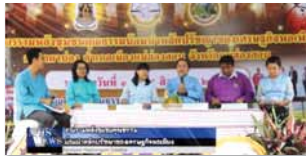
ชุมชนคุณธรรมบ้านผาป่อง จังหวัดแม่ฮ่องสอน www.youtube.com/watch?v=zBlGJjcgJ3M