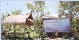
ชุมชนคุณธรรมวัดหนองกระดุกเนื้อ จังหวัดนครสวรรค์ https://youtu.be/6NUC-MKWwsc