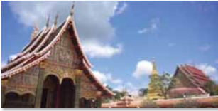
ชุมชนคุณธรรมวัดวังคำ จังหวัดกาฬสินธุ์ www.youtube.com/watch?v=Zj2L-1QZKZ8&t=53s