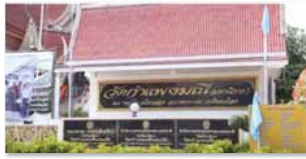
ชุมชนคุณธรรมวัดกำแพงมณี จังหวัดพิษณุโลก www.youtube.com/watch?v=VfsbcblJiI0