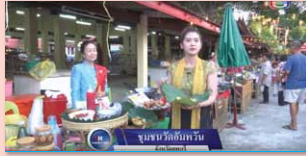
ชุมชนคุณธรรมวัดอัมพวัน จังหวัดลพบุรี www.youtube.com/watch?v=gjEo-Jq-tsA