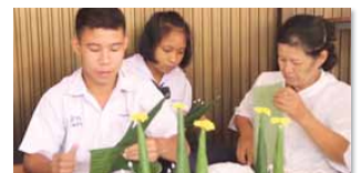
ชุมชนคุณธรรมวัดหลวงสบปราบ จังหวัดลำปาง https://www.youtube.com/watch?v=eNV0MTHAr2Q