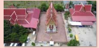
ชุมชนคุณธรรมวัดโคกนอมมหาสวัสดิ์ จังหวัดนนทบุรี www.youtube.com/watch?v=KbuQ72DEU_A