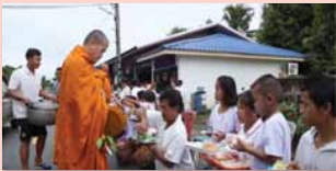
ชุมชนคุณธรรมวัดวังอ้อ จังหวัดอุบลราชธานี https://youtu.be/CvKE0WW90Js