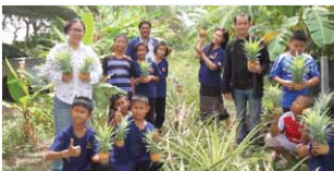
ชุมชนคุณธรรมบ้านไร่ดินไทย จังหวัดประจวบคีรีขันธ์ https://youtu.be/en0JaDd0iYs