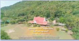
ชุมชนคุณธรรมวัดตะเคียน จังหวัดกาญจนบุรี www.youtube.com/watch?v=8rWd42yVhUA