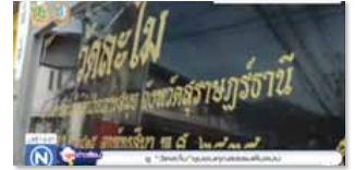
ชุมชนคุณธรรมวัดละไม จังหวัดสุราษฎร์ธานี www.youtube.com/watch?v=k9yVW4EFLg4