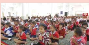
ชุมชนคุณธรรมชอยสอง จังหวัดจันทบุรี www.youtube.com/watch?v=JdTP0I8QMmA&t=168s